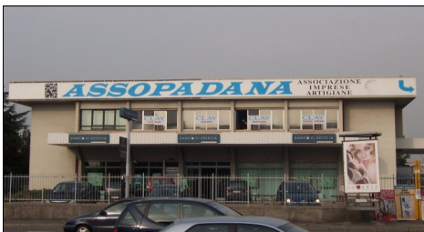
Brescia, la sede di via Lecco 5